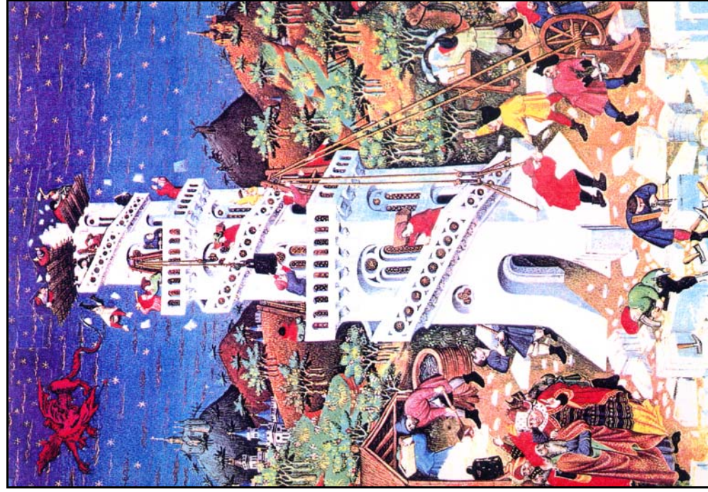
(4) : פְּרָלָה : « Confusion » (Gen., 11:10).