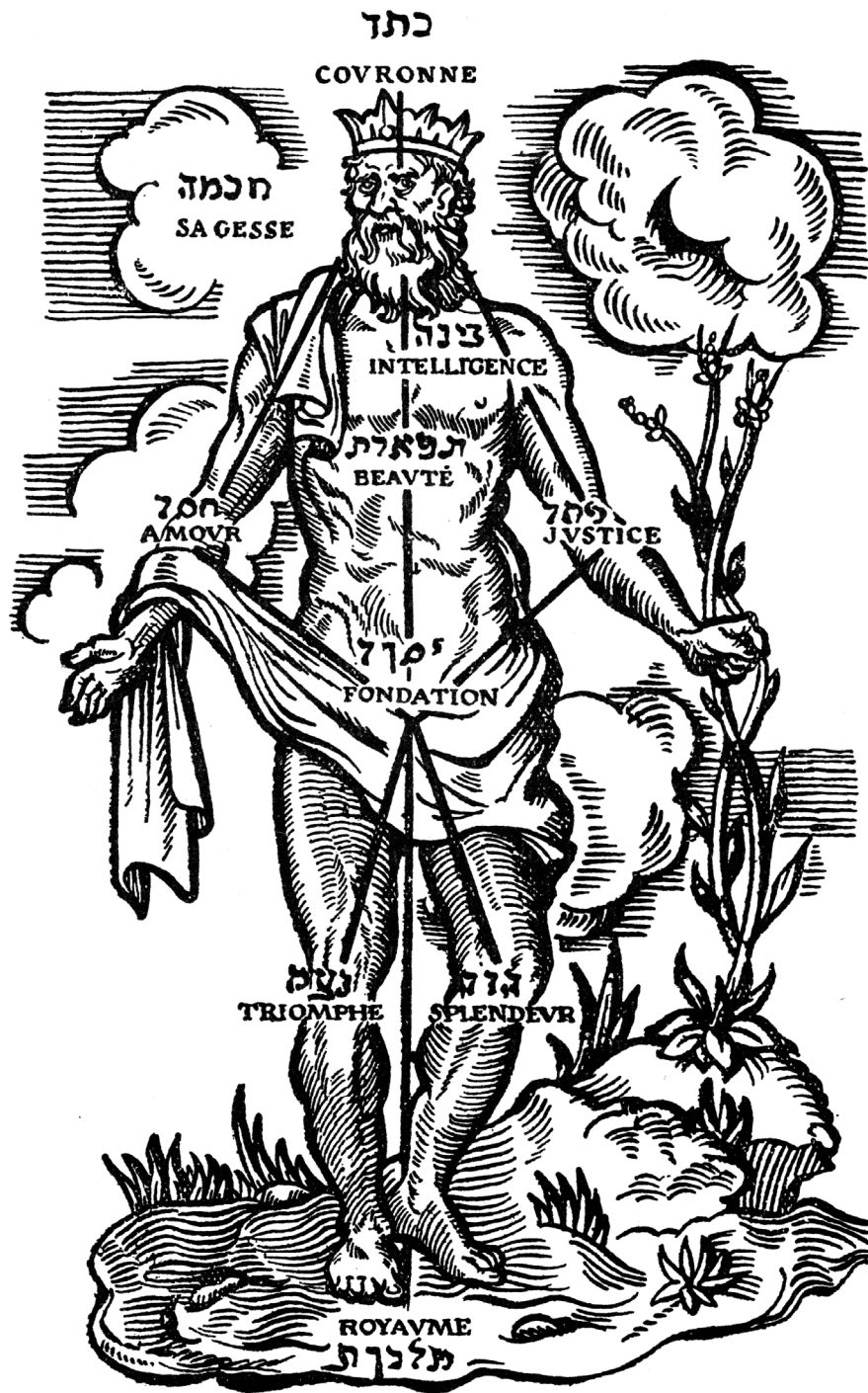
L'Homme primordial, Adam Qadmon.