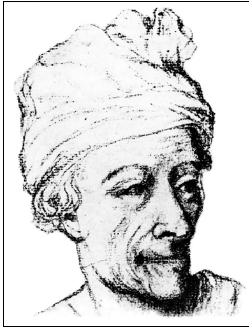
Voltaire – 1760

Perfide laïcité ! qui réduit les naïfs et les ignorants à l’état de Pantins intellectuels.