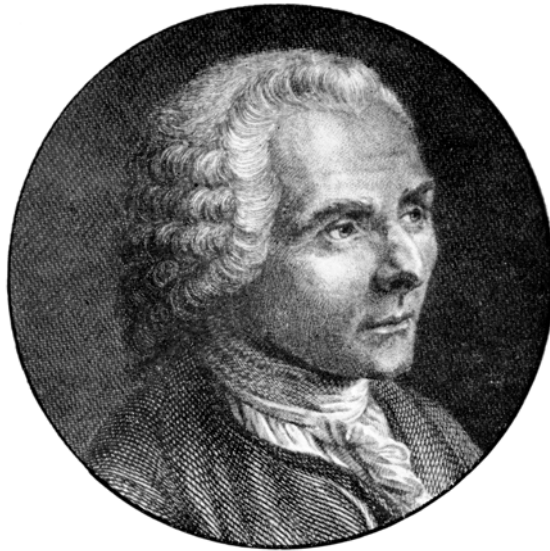
Rousseau – 1762

Honteux système des Acquis Sociaux ! qui ravale la masse, les pauvres et les faibles, au rang de Gueux.