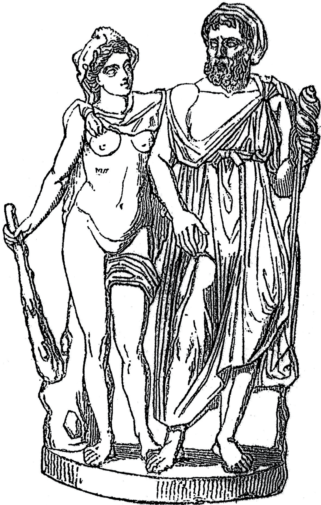
Omphale et Hercule. (Groupe Farnèse, auj. à Naples )