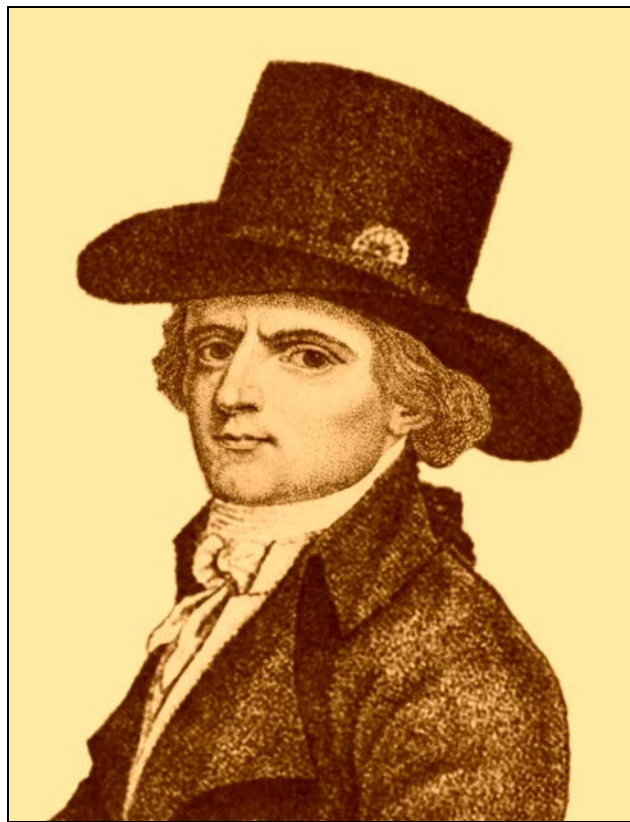
Gracchus Babeuf – 1760-1797